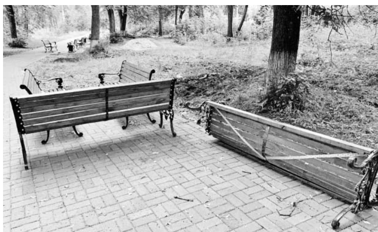
На аллее в сквере у Конки после выходных. 11 июля 2022 года.